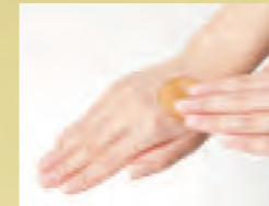
ゴールドジェリーを肌につける