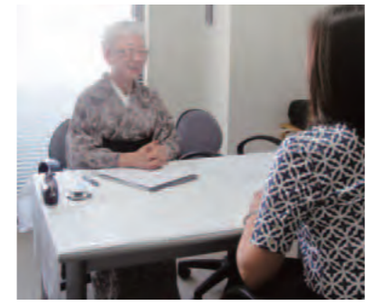
飯田橋カウンセリングルーム COSMOS 不登校・引きこもり・自己開発・人間関係 夫婦関係・高齢者・介護者・子育て支援 〒146-0085 東京都千代田区飯田橋 3-4-3 エレガンス飯田橋 702 TEL : 03-3264-0420 (完全予約制)

慶応義塾大学大学院形成外科修了。ハーバード大学医学部プリガム&ウィーメンズホスピタル形成外科留学。形成外科、美容外科、美容皮膚科を専門とし、美容医療とスキンケアの総合的なアプローチで、女性の美を追求。