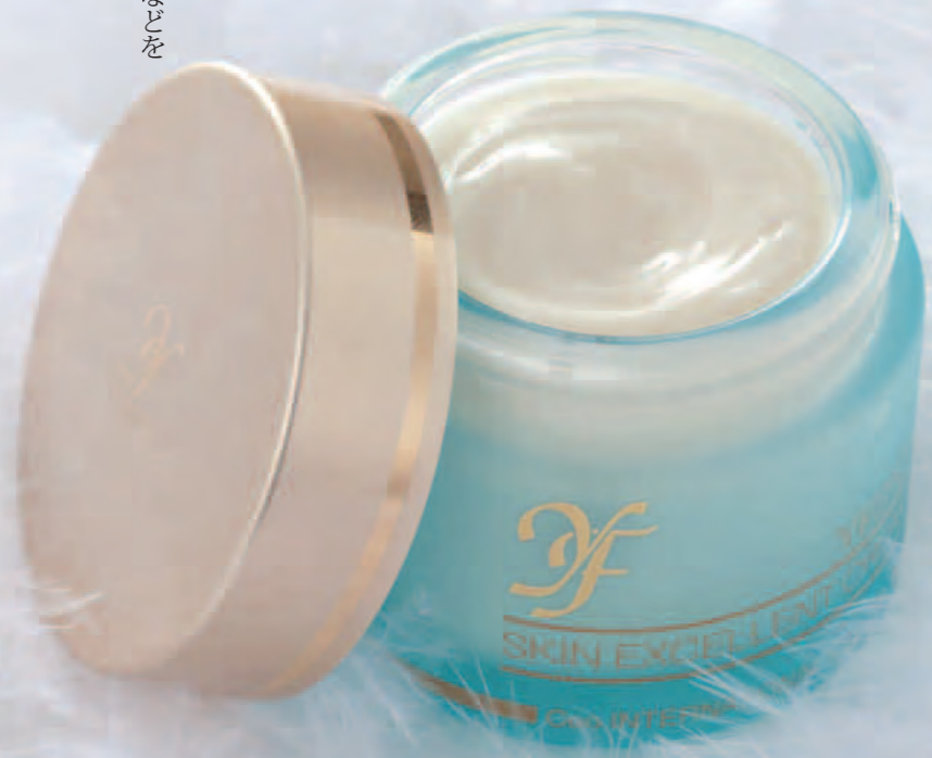
●YFスキンエクセレント クリーム (35g) 12,600円 (税込)

冬の乾燥肌のお手入れにぜひ加えていただきたいのが、お手入れの最後に行く「クリーム保湿」。肌に必要な保湿成分をたっぷりと与え、皮脂膜の働きをサポートしてうるおいを逃しません。 この冬、いちばんのおすすりは、新しくなった「YFスキンエクセレントクリーム」。自然酵母培養液をベースに、グリチルリチン酸2Kやアルブチン、メドゥフォーム油などを新たにプラス。ノバラ油やオレジン油、レモン果皮油などを配合し、合成香料無添加も実現しました。肌にスーッと浸透し、よりいっそう、とろけるような使い心地になりました。