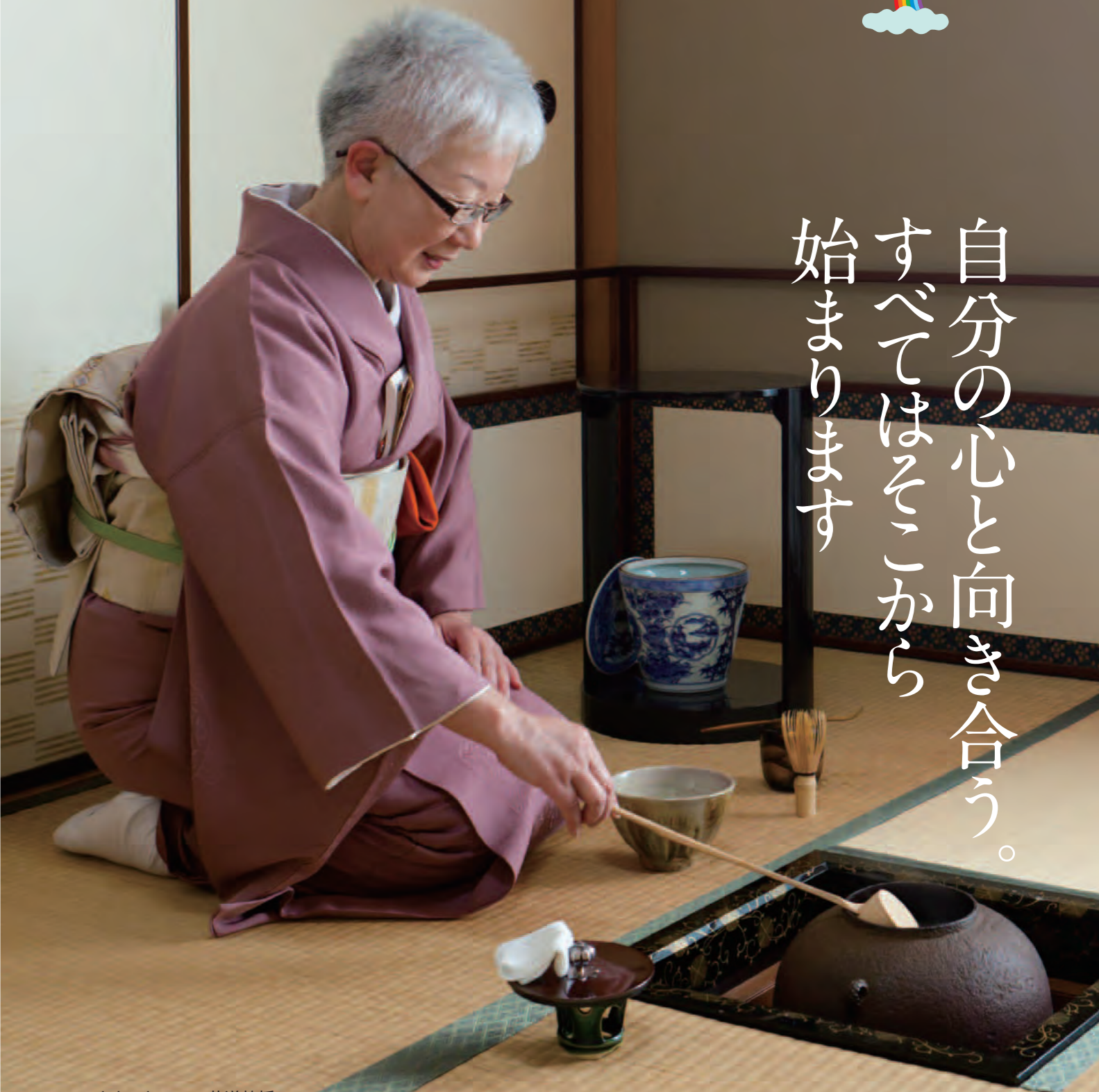
カウンセラー・茶道教授