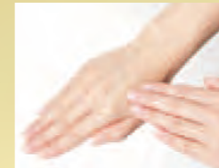
なじませればスーッと溶け込む