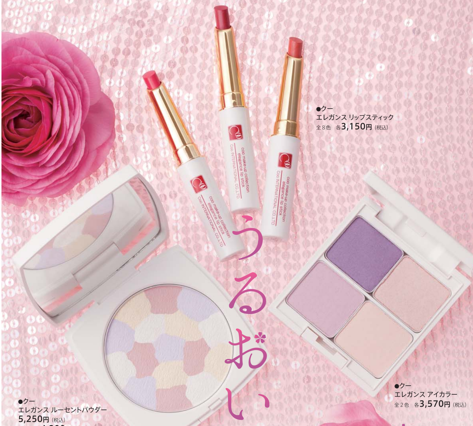
●クー エレガンス リップスティック 全8色 各3,150円(税込)

※店舗情報は2012年2月1日現在のものです。 店舗により、お取り扱い商品が異なる場合がございます。