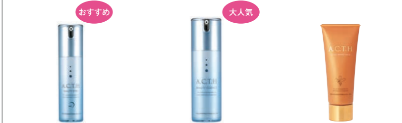
ビューティーアイズ (15ml) 12,000円 (税抜) ビューティーエッセンス (30ml) 22,000円 (税抜) モイストハニー配合温感パック (100g) 7,000円 (税抜)

目元に豊かなハリと深い 潤いを ピンとハリ、プルンと弾力 乾燥し血行が悪くなった肌を やさしく包む