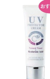
クー・UVプロテクター クリーム (50g) 5,000円 (税抜) SPF35 PA++