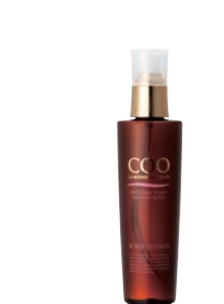
クー・薬用 スカルプローション (180ml) 5,000円 (税抜) 医薬部外品