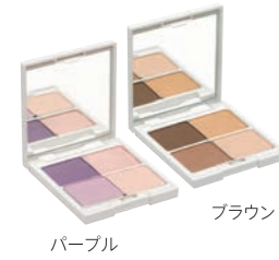
クー・エレガンス アイカラー 全2色 各3,400円 (税抜)