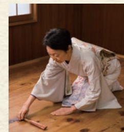
③左手を床についた姿勢で、右手で扇子を身体の前平行に置きます。