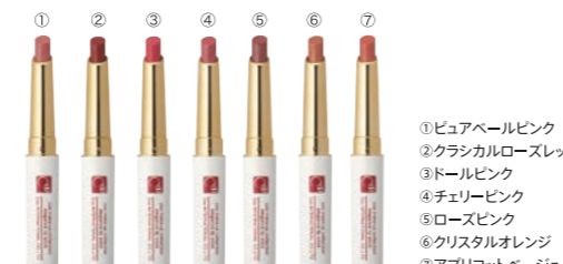
クー・エレガンス リップスティック 全7色 各3,000円 (税抜)