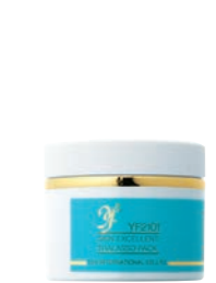
YFスキンエクセレント タラソパック (200g) 15,000円 (税抜)