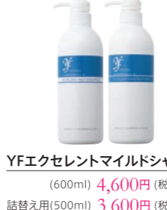
YFエクセレントマイルドシャンプー (600ml) 4,600円 (税抜) 詰替え用(500ml) 3,600円 (税抜)