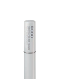
薬用クー・リップクリーム 3,000円 (税抜) 医薬部外品