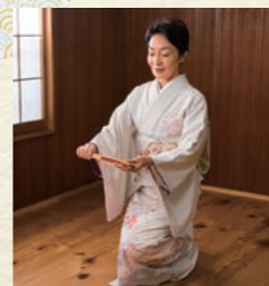
②右足を少し後ろに引いて床に右ひざをつき、左ひざもついて正座します。