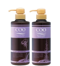
クー・薬用スカルプ シャンプー・コンディショナー 各(400ml) 各3,800円 (税抜) 医薬部外品