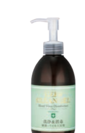
薬用ディープ クリーンジェル (250ml) 1,715円 (税抜) 指定医薬部外品