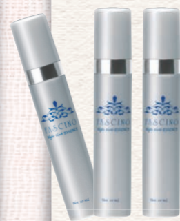
アルブチン配合 清らかな白肌へ ファシーノ ナイトハーブエッセンス (10ml x 3本入り) 30,000円(税抜)

紫外線ダメージは毎日、少しずつ蓄積していつか将来、肌にシミやシワとなって現れます。それを防ぐには、UVケアはもちろん、美白ケアも根気強く続けること。いつもより紫外線を浴びた日は、寝る前の美容液で睡眠中に集中ケアを。