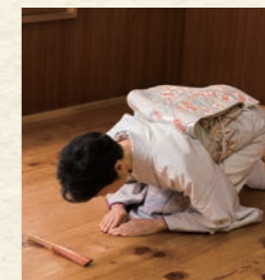
④扇子の手前、正面に両手をつき、両ひじが床につくまでゆっくり頭を下げます。