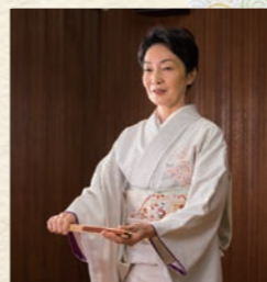
①足を揃えて立ち、扇子を身体の前、帯締めの高さに持ちます。

美しい所作や立ち居振る舞いは、着物姿を美しく見せる重要なポイントです。日本舞踊のお稽古で行う、扇子を使うごあいさつを教えていただきました。