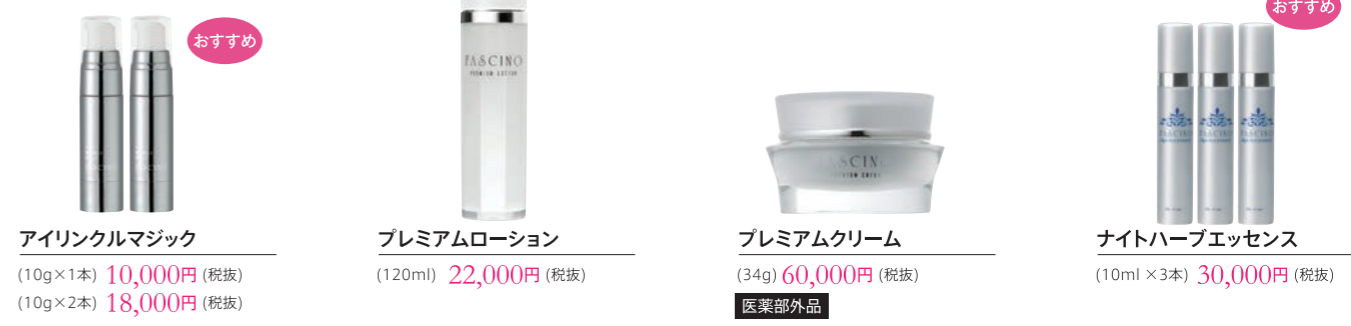
アイリンクルマジック (10g×1本) 10,000円 (税抜) (10g×2本) 18,000円 (税抜) プレミアムローション (120ml) 22,000円 (税抜) プレミアムクリーム (34g) 60,000円 (税抜) 医薬部外品 ナイトハーブエッセンス (10ml×3本) 30,000円 (税抜)

小ジワに集中ケア。 肌の内側からみなぎるハリ 美容液のような濃密ローション ナノ化された豊かな有効成分で エイジングケア 寝ている間の集中美白ケア