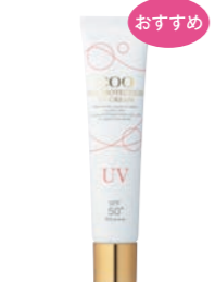
クー・ディプロテクション UVクリーム (40g) 4,000円 (税抜) SPF50+ PA+++