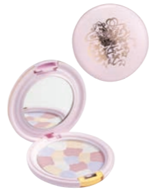
クー・エレガンス ルーセントパウダー 5,000円 (税抜) レフィル 4,000円 (税抜)