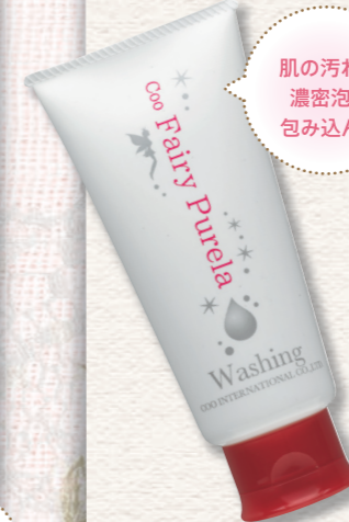
クー・フェアリーピュアラ洗顔フォーム (120g) 2,600円(税抜)

毎日、朝晩行う洗顔は、汚れを落とすと同時に肌に必要な油まで落としてしまいがち。熱めのお湯や肌への摩擦刺激、すすぎ残しなどは、さらに肌を乾燥させるので要注意です。保湿成分入りの洗顔料を選び、やさしく洗しましょう。