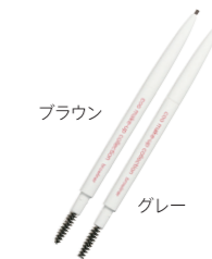
クー・エレガンス プロウライナー 全2色 各2,000円 (税抜)