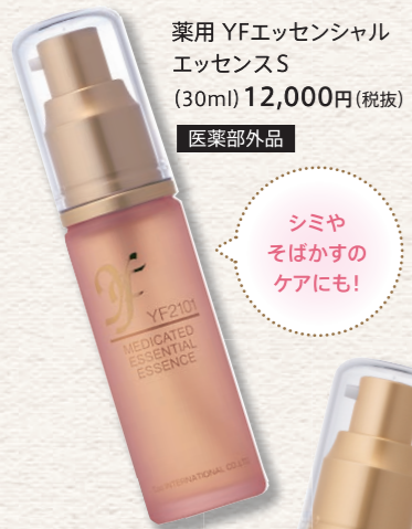
薬用 YFエッセシャルエッセンスS (30ml) 12,000円(税抜) 医薬部外品

紫外線がますます強くなり、疲れがたまってきた肌さらにダメージを与えます。乾燥が進み、肌荒れが気になる人も増えるこの時季、酵母培養液がたっぷり入った美容液で入念なお手入れを。乾きがちな目元や口元には二度づけしましょう。