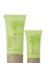
クー・モイストハンド トリートメント 2本セット (70g+30g) 4,000円 (税抜)