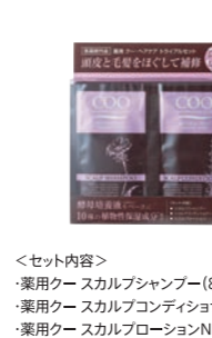
クー・薬用ヘアケア トライアルセット 1,200円 (税抜) 医薬部外品