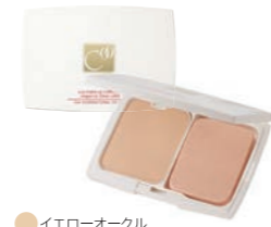
クー・エレガンス 2ウェイクキー(SPF15 PA+) 全2色 各4,600円 (税抜) レフィル(ナチュラルオークルのみ) 3,600円 (税抜)