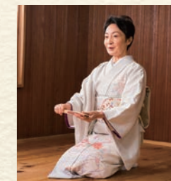
⑤ゆっくり頭を上げて正座の姿勢に戻ったら、右手で扇子を取ります。