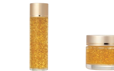
YF ゴールドローション (150ml) 6,000円 (税抜) YF ゴールドジェリー (40g) 6,000円 (税抜)