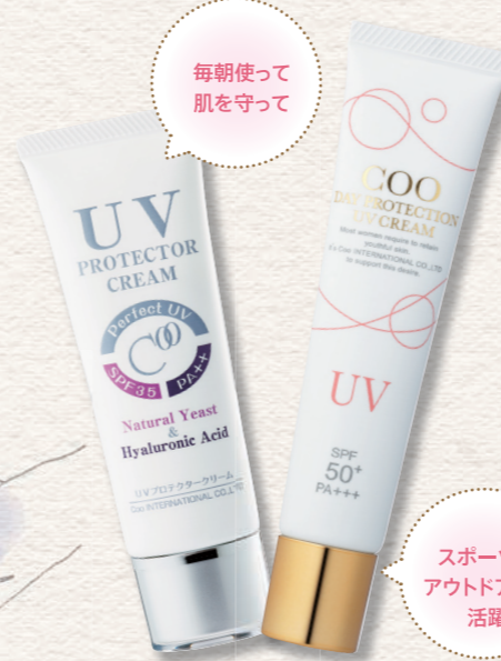
(右)クー・ディプロテクションUVクリーム (40g) 4,000円(税抜) (左)クー・UVプロテクタークリーム (50g) 5,000円(税抜)

ベランダで洗濯物を干したり、近くまで買い物に行ったりするだけでも、紫外線は肌を直撃。室内で過ごしていても、長い波長の紫外線は窓ガラスを透過します。家にいるからと油断せず、スキンケア感覚で日焼け止めはつけましょう。