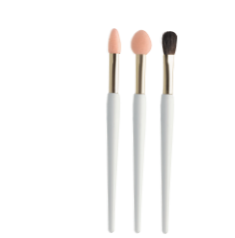
クー・エレガンス アイカラーブラシ(ケースつき) 3本セット 600円 (税抜)