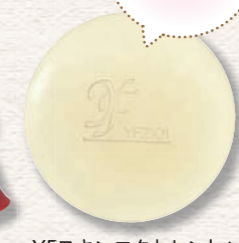
YFスキンエクセレントソープ (100g) 3,800円(税抜)