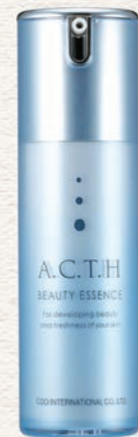
A.C.T.H ビューティーエッセンス (30ml) 22,000円(税抜)