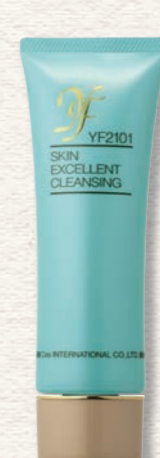
うるおいを与えながら落とす! YFスキンエクセレントクレンジング (110g) 5,000円(税抜)

使用するクレンジングの量が足りないと、メイクを落とす際に肌をこすってしまいがち。摩擦刺激を減らすためにも、クレンジングはたっぷり使って。チューブ入りなら3cm程度が目安です。力を入れず、指の腹を使ってやさしくなじませよう。