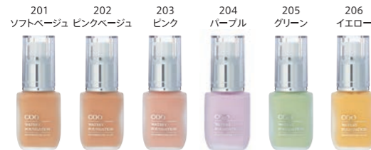
クー・ウォーターファンデーション (各30ml) 各3,500円 (税抜)