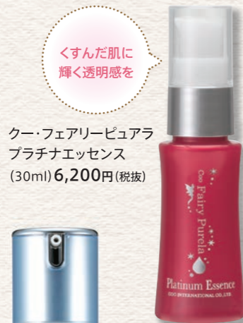
クー・フェアリーピュアラプラチナエッセンス (30ml) 6,200円(税抜)

朝起きて、まず鏡を見る習慣を。肌をじっくりチェックして、乾燥やくすみ、ハリ不足など、そのときどきの状態を見極めて、肌が求めているケアを心がけましょう。美白やハリケアなど、目的に合わせて、美容液を用意しておくこともおすすめです。