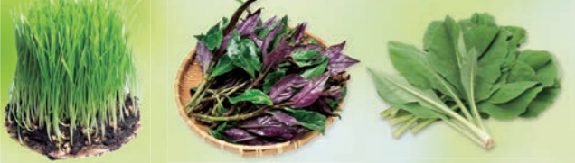
九州産 大麦若葉 ミネラル群をはじめ、さまざまな栄養素を多く含んでいます。 沖縄産 ハンダマ (スイゼンジナ) 鉄分、マグネシウム、ビタミンAが多く、アミノ酸も含んでいます。 沖縄産 ニガナ (ホソバ、ワダン) ビタミンCやカロテン、カルシウムを豊富に含んでいます。