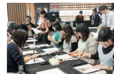
上) 子どもから大人まで、それぞれが通う書道教室8カ所、指導しています。 左) お正月のイベントでパフォーマンス書道を披露。最近では、海外でのイベントに招かれることも増えているそうです。