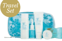
YFスキンエクセレント トラベルセット 【セット内容】・クレンジング(25g)・ソープ(8g)・トリートメント (50ml)・エッセンス(10ml)・クリーム(8g)

自然酵母培養液をベースに、保湿効果が 高いヒアルロン酸ナトリウムや水溶性コラ ーゲン、肌本来の美しくなる力とする力を 引き出すプラセンタエキスなどを配合。み ずみずしさと透明感にあふれた素肌を取り 戻したい方におすすめです。