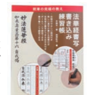
『法華経書写書き込み練習帳』(創開出版社)