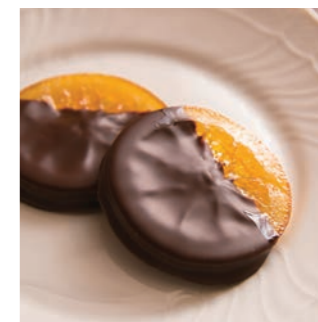
「スペイン産オレンジのチョコ コがけ」(1枚 320円)もファ ンが多い人気商品。