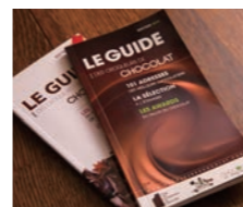
フランスのショコラ専門ガ イドブック『LE GUIDE』 に記載されるのは、ショ コラティエとして非常に名 誉なこと。

原材料のチョコレートと生クリームを 混ぜてガナッシュを作る作業も、一口大 にカットしてからチョコレートをかける 作業も、機械はまったく使わず、すべて 手づくりで行っています。 「うちのボンボンショコラは、外側のシェ ルの味を内側のセンターに合わせて全部 変えています。そうすると、機械を使っ て一律に、ということができないんです。 味にこだわれば、少しずつ配合を変えた ものを手がけるしかありません」 チョコレートは、非常に扱いが難しい デリケートな素材といわれています。 「暑いところも寒いところもダメ、蛍光 灯の光で酸化してしまうし、風が当たる