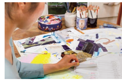
日傘の生地を決めるのも真剣そのもの