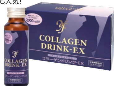
YF コラーゲンドリンクEX (50ml×10本入り) 5,000円(税抜)

年齢を重ねるにつれて、厳しい暑さに体力を奪われ、夏バテしやすくなります。肌や髪にハリやツヤがなくなったら、クーのコラーゲンドリンクを！スッポンエキスや発酵コラーゲンペプチド LCP がパワーをチャージ。飲みやすくスッキリとした後味も人気！