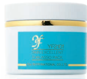
YF スキンエクセレント タラソパック (200g) 15,000円(税抜)

薄着になる夏は、ボディのざらつきやくすみも気になります。クーのタラソパックで集中ケアしましょう。海藻エキスが毛穴の汚れまで吸着し、メラニンを含んだ古い角質を落とすすべすべに。洗い流すと明るい肌を実感できます。