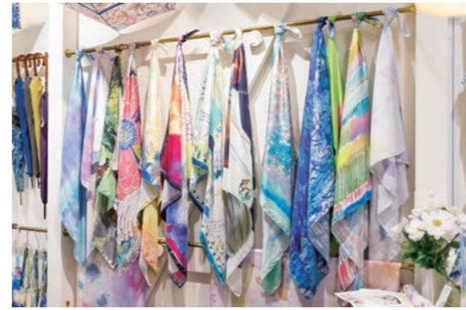
上質なシルクのスカーフも人気アイテム