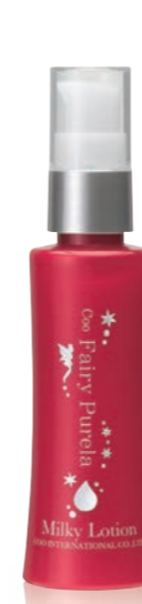
クー・フェアリーピュアラ ミルクローション(70ml) 4,000円(税抜)

湿度が高くなって蒸し暑い梅雨や真夏は、クリームをつけるとベタついて苦手な方も多いでしょう。しかし、夏の肌は一見うるおっているように見えても、内部が乾燥しているインナードライの状態になりがちです。ローションでうるおいを与えた後は、クリームよりつけ心地が軽い乳液などでしっかりと保湿することを心がけてください。