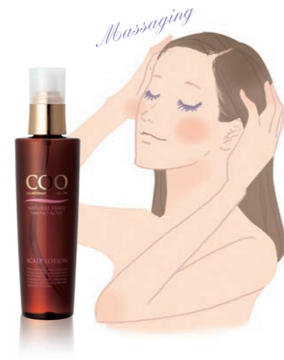
クー・薬用 スカルプローション (180ml) 5,000円(税抜) 医薬部外品

夏の紫外線は頭皮も直撃。過剰な汗や皮脂も頭皮にダメージを与えます。頭皮用の薬用ローションで毎日のマッサージを習慣に。