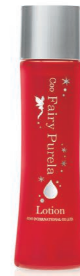
クー・フェアリーピュアラ ローション(120ml) 3,800円(税抜)