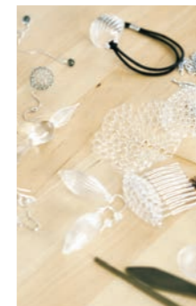
ピアスやヘアアクセサリー、ピンブローチなども人気。