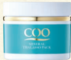
クー・ミネラルタラソパック (200g) 15,000円(税抜)