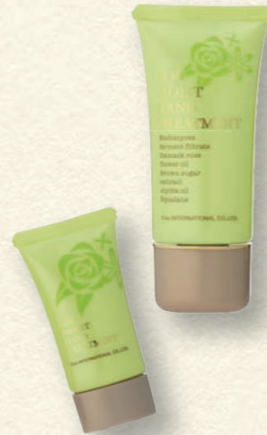
クー・モイストハンドトリートメント 2本セット(70g+30g) 4,000円(税抜)

夏の間、無防備に紫外線にさらされていた手には、ダメージが蓄積しています。自然酵母をはじめ、スクワランやセラミドなど贅沢な美容成分をナノ化して配合したトリートメントでケアしましょう。すばやく浸透してサラサラに!