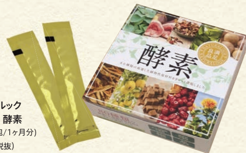
ナチュラルック 満足良品 酵素 (3g×30包/1ヶ月分) 7,000円(税抜)

加齢はもちろん、夏バテなどで体力が消耗すると、体内で重要な働きをする酵素が不足してしまいます。80種類もの野草や野菜、果物などを熟成・発酵させた「酵素」を毎日の習慣にしましょう。自然の恵みで元気に!