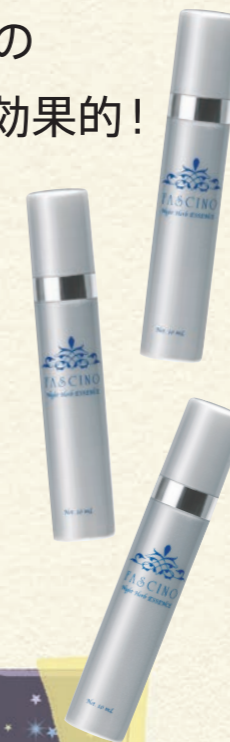
ファシーノ ナイトハーブエッセンス (10ml×3本) 30,000円(税抜)

肌のトラブルは複合的に現れるもの。それらを全部まとめてケアするには、美肌をつくるリズムが高まっている夜に使う集中美容液がおすすめです。寝る前に顔全体に塗っておくと、睡眠中に肌が新しく生まれ変わるのをサポート。甘くさわやかなハーブの香りも安眠を誘ってくれます。