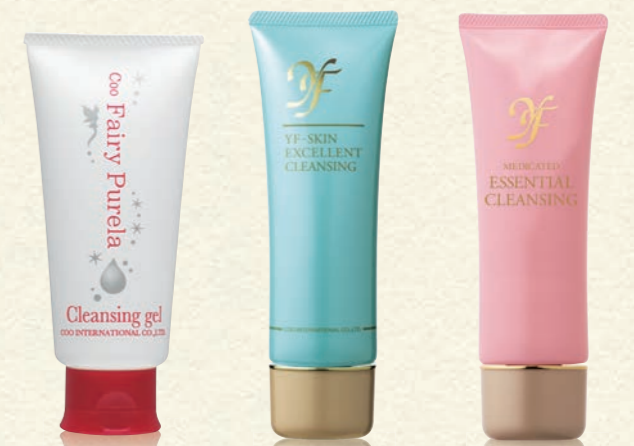
クー・フェアリーピュアラ クレンジングジェル (120g) 3,000円(税抜)

夏に浴び続けた紫外線などが原因で肌のバリア機能が低下すると、クレンジングなどが刺激になって肌荒れを起こすことも。そうかといって、クレンジングを使わなければメイクをきれいに落とせず、かえって肌荒れを悪化させてしまいます。保湿力の高い自然酵母を配合したクレンジングで、肌に優しくメイクを落としましょう。