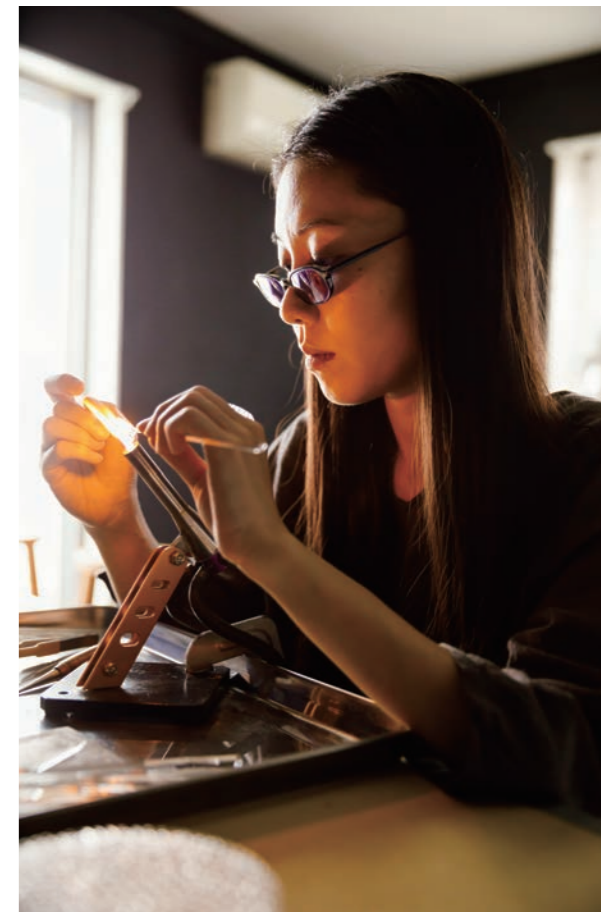
涼しい印象のガラスですが、工房での作業は火を使うので熱い。ボロシキレットという固いガラスを材料に使います。