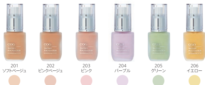
クー・ウォーターリーファンデーション (各30ml) 各3,500円 (税抜)