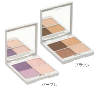
クー・エレガンスアイカラー パープル 全2色 各3,400円 (税抜)