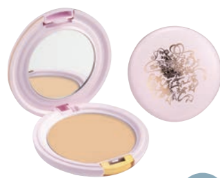
クー・エレガンスルーセントプレストパウダー SPF15 PA+ 5,000円 (税抜) レフィル 4,000円 (税抜)