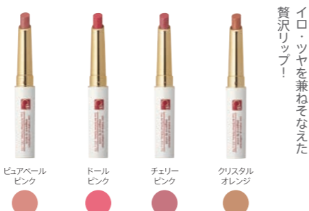
クー・エレガンスリップスティック 全5色 各3,000円 (税抜)